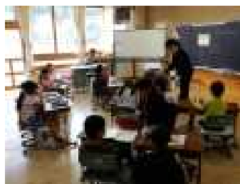
2年「たしざんのきまり」