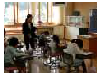
4年「漢字の組み立て」