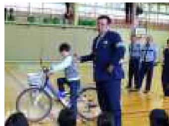
5/14自転車教室 安全な乗り方を教えていただきました。