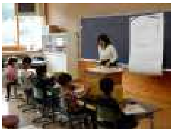
3年「国語じてんの使い方」