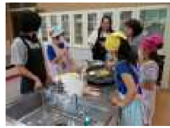
5/17親子活動 4年生が親子でパフェ作り。おいしかった!