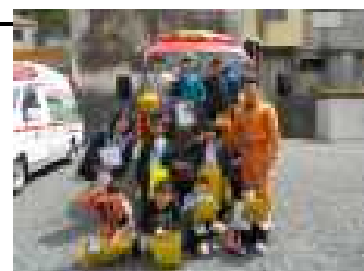
5/8市内巡り① 3年生が秋山地区の施設を巡りました。