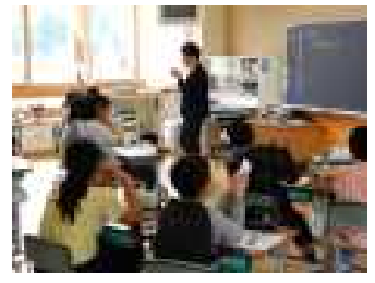
6年「線対称をかこう」