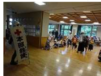
避難訓練（土砂災害想定）