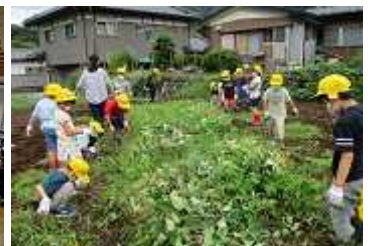
サツマイモ畑の草取り1, 2年