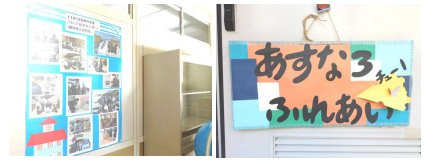
<あすなろ・ふれあい(1年)>