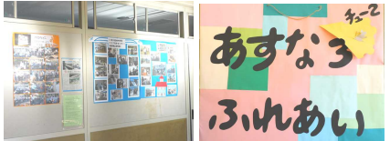
<あすなろ・ふれあい(2年)>