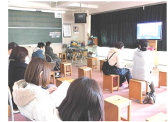
リモート授業参観