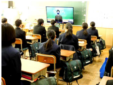
始業式 (オンライン)