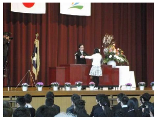
証書が授与されました。