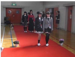
卒業生が入場し開式です。

これから続く長い人生、精一杯生きてほしいと思っています。そして、今生きていることに感謝しながら、輝かしい未来を切り拓いていって欲しいと思っています。自分らしく活躍することを心から期待し、はなむけの言葉としました。