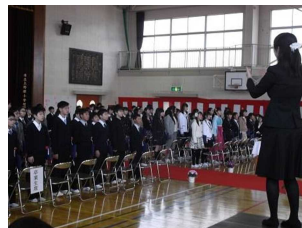
「卒業式の歌」の合唱です。