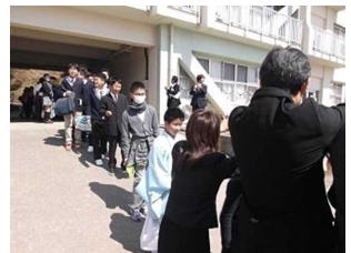
校庭で見送りました。