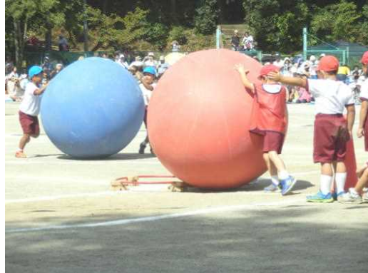
《二年 大玉ゴロゴロ》

今年の全体スローガンは、「燃えあがれ! 3つの星の大決戦 心を一つに仲間と共に優勝目指して駆け抜けろ!」で、どの色も力を合わせて、競い合いました。