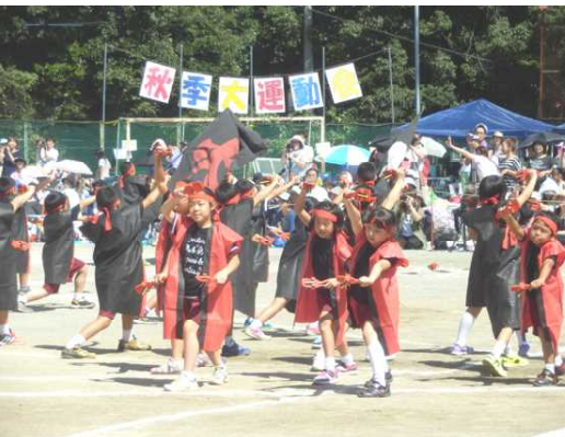
《三・四年 THE TAKEDA 武士》

お忙しい中をご参加いただきましたご来賓の皆様、また早朝より子どもたちを応援して下さった保護者の皆様、ご家族の皆様ありがとうございました。