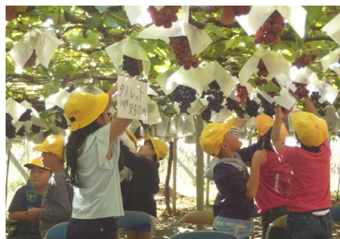
4年遠足 ぶどう狩り

学期途中での日課時刻の変更で、ご迷惑をおかけしますが、子どもたちの学習活動の時間を増やすという理由をご理解下さい。よろしくお願います。