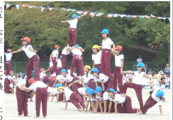
《五・六年 組立体操 上の写真は、新しい演技の「人間起こし」です。仲間を信頼してできる技です。短い時間で完成させました。》

「学校だけの力じゃできないなあ。」運動会が終わって、いつも思うことです。三・四年の表現「武田武士」は、地域の方に毎年指導をしていただいています。また、当日の運営には、PTAの役員の皆様にお手伝いをいただきました。運動会終了後は、保護者の皆様が進んで片付けを手伝ってくれました。保護者や地域の皆様に支えられて、運動会の成功があったと心より感謝しています。