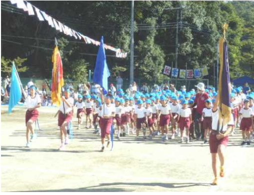
《全校児童による入場行進》

今年の全体スローガンは、「燃えあがれ! 3つの星の大決戦 心を一つに仲間と共に優勝目指して駆け抜けろ!」で、どの色も力を合わせて、競い合いました。