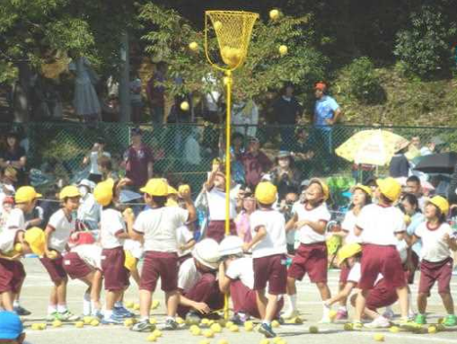
《二年 ダンシング玉入れ》

お忙しい中をご参加いただきましたご来賓の皆様、また早朝より子どもたちを応援して下さった保護者の皆様、ご家族の皆様ありがとうございました。