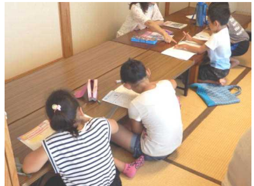
(フォローアップ教室学習風景)