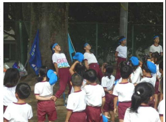
(応援練習、高学年が低学年を指導します)

いい動きをお楽しみ下さい。 三・四年生の表現「THE TAKEEDA 武士」は、早いリズムにだんだん動き