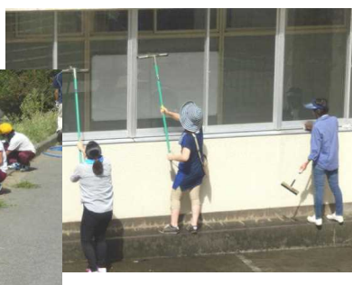
ガラスもきれいになりました

八月二十二日(日)にPTA奉仕作業が行われました。今年も暑い日となりましたが、保護者の皆様が百三十四名、六年児童と本校教職員を合わせて、二百四十名を超える皆様にご参加いただき、日頃できない箇所の清掃や草取りをしていただきました。保護者の皆様、お忙しい中をご参加いただき、ありがとうございます。