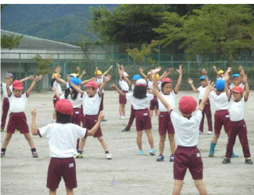
(二・三年生かわいさいっぱいです)

そして、なんといっても運動会のメインは、五・六年生の組立体操です。練習を重ねた力強い演技を楽しみにして