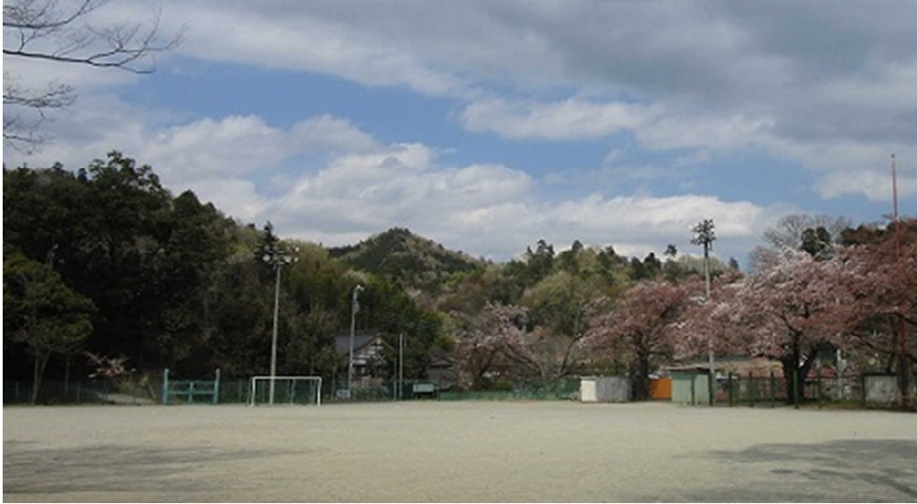
▲4/11. 第1グラウンドから見る新緑の山々