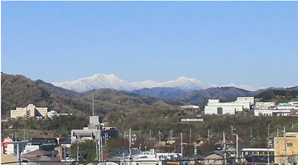
▲4/14. 冷え込んで高い山は雪景色・・・