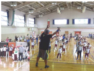
4年 レクリエーション ダンス

どの学年も工夫を凝らして、親子で楽しい一時を過ごしました。会場となった教室や体育館には、笑顔があふれ、楽しさいっぱいの声が響いていました。