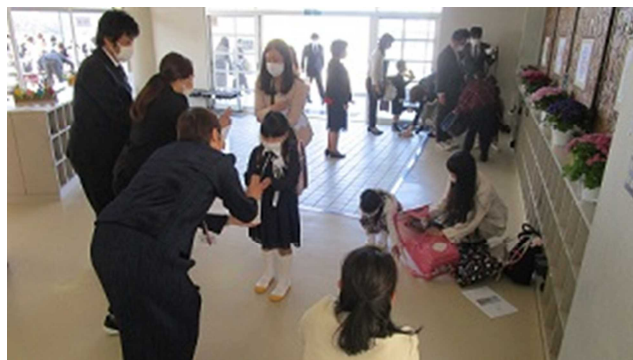
▲1年生も入学してもう8ヶ月もたちました・・・