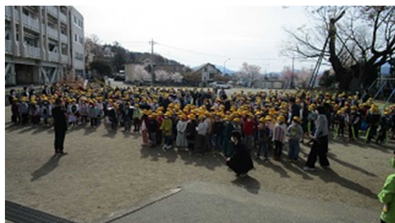
▲新任式、始業式・・・