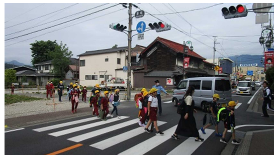
▲6/1(月)学校再開・・・

※ご家庭でもホームページで1年を振り返ってみてください・・・よいお年をお迎えください・・・