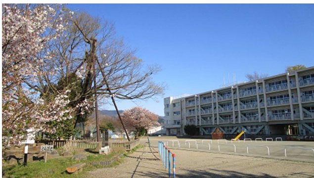
▲入学式の日の学校。既に懐かしいです・・・

振り返ると、5/20(水)に1年生と4年生が、21日(木)に2年生と5年生が、22日(金)に3年生と6年生がそれぞれ分散登校を行いました。受け入れにあたって、消毒作業やソーシャルディスタンスの確保のための教室の座席配置の見直し、健康状態の確認、学級での活動内容などを何度も練り直し、その時点でできる限りの対応を行いました。翌週の25日(月)からは全校体制で半日登校を行い、6/1(月)の学校再開に向けて市教委とも連携しながら準備を進めました。長く臨時休業が続いた後、子どもたちの姿が戻ってきた学校を見て、やはり学校は子どもたちのいるべき場所なんだという思いを改めて強くしました。まだまだ、予断を許さない状況が続いていますが、これまでの経験を生かしながら、学校が子どもたちにとって安心・安全で楽しく学べる場所であるために、力を尽くしていきたいと考えています。保護者や地域の皆様方には今後ともお力を貸していただきたいと思います。どうかよろしくお願いたします。