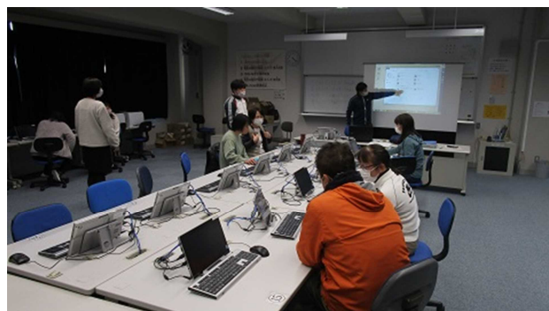
▲ICTの利活用に向けて研修を繰り返しています