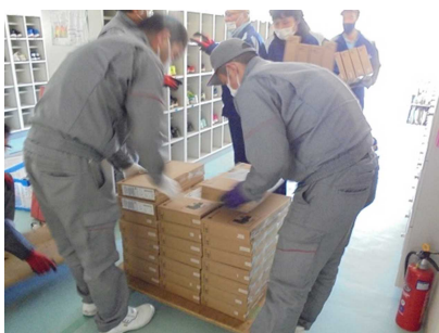
▲昨年度2月に400台以上が納品されました

7/7（水）より、GIGA スクール構想により導入された一人一台のパソコンを自宅に持ち帰る取組を始めました。上野原市教育委員会からも様々な情報が提供されています。学校でも新しい時代を生きる子どもたちのために、今できることに積極的に取り組んでいます。GIGA スクール構想は、コロナウイルスの感染拡大が始まる前から準備されてきましたが、コロナ禍による緊急事態宣言を受け早期実現のための取組が加速しました。ホームページ等でも紹介してきましたが、昨年度2/18に一人一台のパソコンが本校に納品されて以来、活用のための学習会や児童への指導を行ってきました。せっかく整備していただいた機器を大切に使うために、保管庫の準備や一人ひとりのパソコンへのナンバーの貼り付け、充電のための機器やイヤホンマイクの準備など、職員で協力して進めてきました。400を超える機器の設定や準備は非常に大変な作業でしたが、子どもたちのためにできることを職員一同ほんとうによくやってくれたと思っています。この間、保護者の皆様にも活用に向けての状況調査などにもご協力をいただきありがとうございました。さてこれからが本番です。子どもたちに新しい時代を生き抜くための学力や生活力をつけるために、我々教職員も学び続ける集団でありたいと思います。ICT以外の分野でも、それぞれが知恵を出し合い、学び合いながら、日々どうしたらよくなるか考え行動しています。保護者の皆様には、引き続きご理解とご協力をお願いすることになると思いますが、子どもたちのためにも力を合わせていきたいと思っています。どうぞよろしく願いいたします。