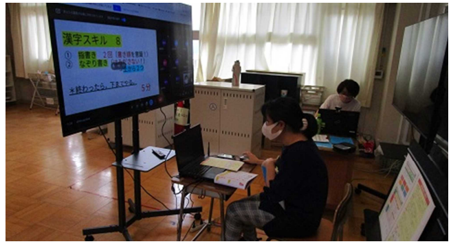
▲ 6年生の分散登校授業配信の様子