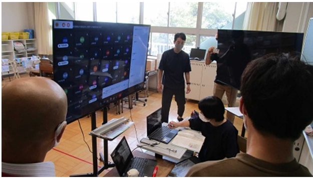
▲ 5年生の分散登校授業配信の様子