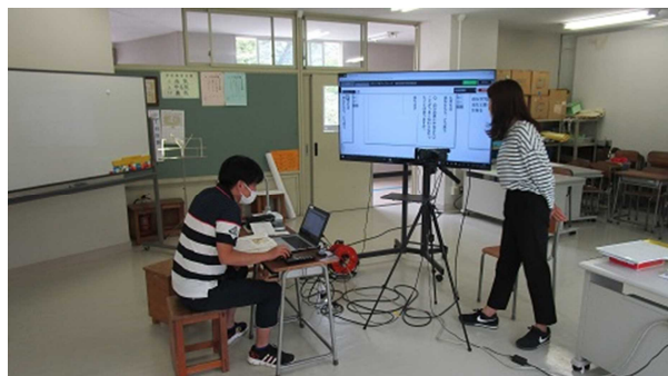
▲4年生のリモート授業配信の様子