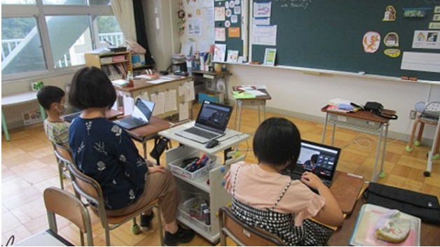
▲ けやき学級分散登校授業の様子