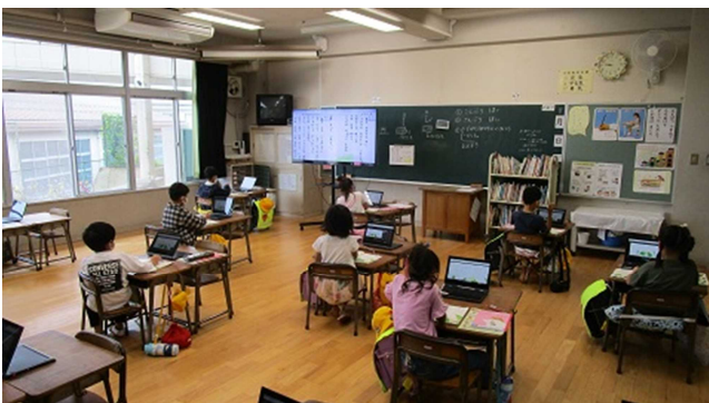
▲ オンライン学習をする児童の様子