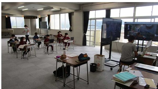
▲3年生の分散登校授業配信の様子