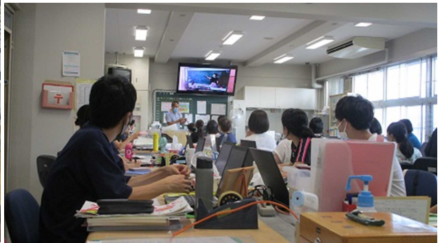
▲ 職員のリモート授業の振り返りの様子