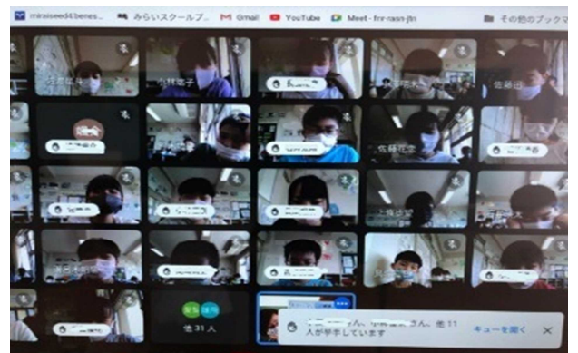
▲ 通信環境の関係で通常は画像オフで利用

※運動会が10/9(土)に予定されています。学校では、予定どおり実施できるよう感染症拡大防止に取り組んでいます。ご家庭でもこれまで以上に健康観察等を念入りに行っていただき、ご家族も含めて体調の悪い方がいる場合は、大事をとって登校を控えていただくようお願いいたします。体温チェックカードを忘れないように出かける前に確認をお願いいたします。これまでどおり感染症に関わって嫌な思いをする人が出ないようにみんなで心がけましょう。保護者、地域の皆様のご理解とご協力をお願いいたします。