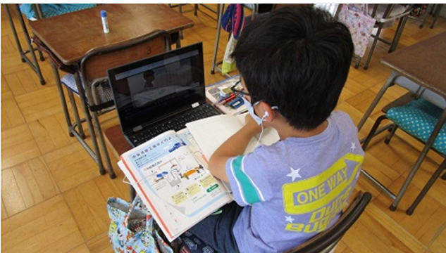
▲ オンライン学習をする児童の様子