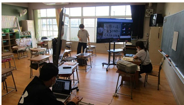
▲1年生のリモート授業配信の様子

子どもたちにも、変化がありました。イヤホンをつけて受ける授業は、周囲の雑音がないため、いつも以上に集中して授業に取り組む様子も見られました。また、先生方が工夫して教材や板書を児童に提示していたため、普段教室で受ける授業より、黒板や教材が見やすく感じることもありました。先生方も役割分担して授業を行ったため、日常では気づけない子どもたちの変化を感じたり、いつも以上に個別指導にあたりやすくなることもできました。学校での学習経験はとりわけ小学生には極めて大切だと思っていますが、オンラインの学習をしたからこそ、気づくことができた学習効果もありました。機器の活用に関しては、情報モラルや健康面への影響など危惧される面もたくさんあります。しかし、オンラインでもオフラインでも課題はあり、そうした課題にしっかりと向き合いながら乗り越えていく力をつけていくことが、子どもたちの将来につながると思っています。我々教職員は子どもたちと一緒にコロナ禍を乗り越えていくために知恵を絞っていきたいと思っています。保護者や地域の皆様にも様々なお考えがあると思います。是非、どうしたらよくなるのか一緒に考え行動していただきたいと思います。今後ともご理解とご協力をお願いいたします。