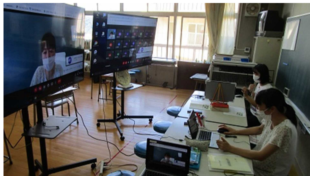
▲2年生のリモート授業配信の様子