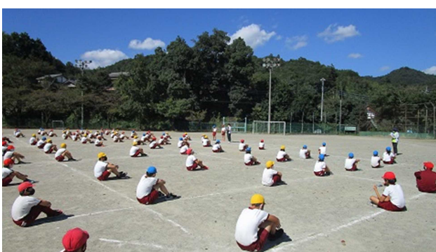
▲5.6年生の練習の様子・・・