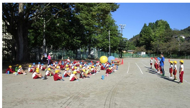
▲2年生の練習の様子・・・