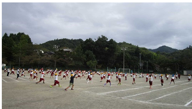
▲3.4年生の練習の様子・・・