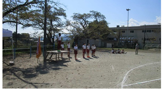
▲児童会役員たちの開閉会式の練習・・・