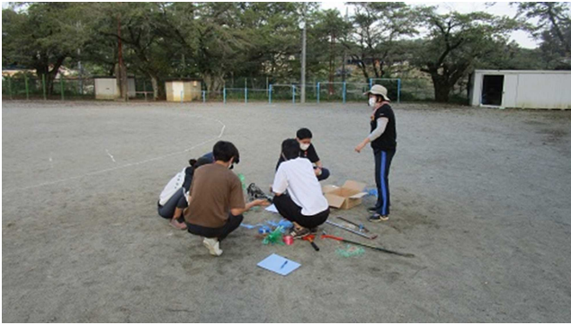
▲リスク回避のためのポイントうち作業・・・