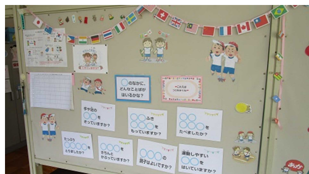
▲安全に練習を進めるための掲示・・・