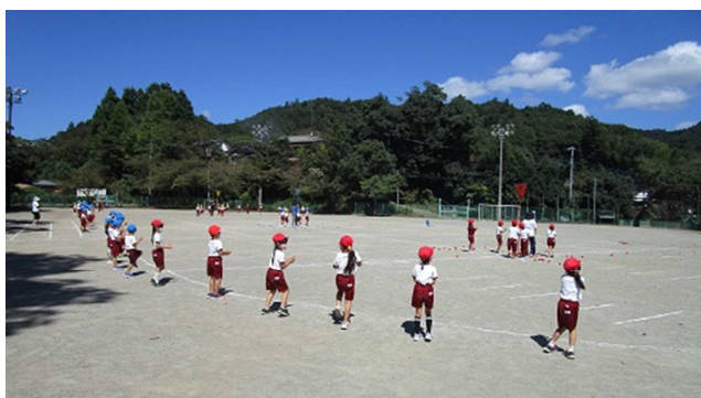
▲1年生の練習の様子・・・

本年度の運動会の実施にあたっては、年度始めから体育担当職員を中心に何度も何度も計画を練り直し、安全・安心を第一に考えながら、活動のねらいを達成するために工夫を重ねてきました。子どもたちの発達段階を考えながら、種目や時間設定を考えたり、様々な係活動の計画を練ったり、当日の時間設定を検討したり、PTAのみなさんにも協力を仰いだり・・・みんなで運動会を作り上げてきました。すべての子どもたちが取り組んだ経験を生かし、それぞれの力を発揮できることを心から願っています。統一学年便りでも、各学年の登校時刻や持ち物、競技・演技の情報などをお伝えしていますが、是非お子さんの口からも運動会の情報を聞き取っていただきたいと思います。様々な制約もありますが、保護者や地域の皆様にも子どもたちのがんばりを支えていただければ幸いですようお願い申し上げます。