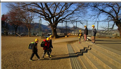
対策を講じながらあいさつ運動