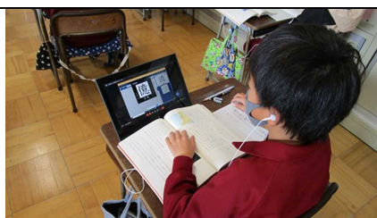
一人一台端末の活用