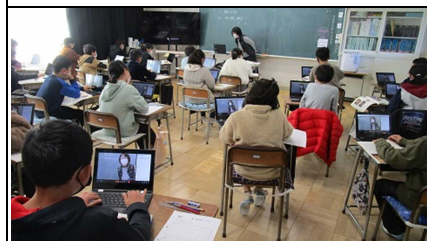
リモートとリアル授業