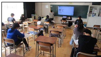
教室を分散しての授業

学校はこれまでどおり感染症に関わっても嫌な思いをする人が出ないように全力を尽くしたいと思っています。保護者、地域の皆様のご理解とご協力をお願いいたします。