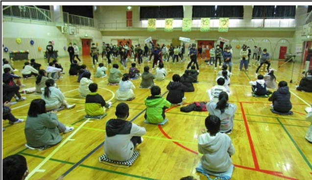
5年生のダンス・・・

2/25(金)に6年生を送る会がありました。コロナ禍で様々な制約のある中で5年生を中心に6年生に感謝の気持ちを伝える会を作り上げていました。6年生に様々な形で感謝の気持ちを伝える動画が上映され、6年生もうれしそうに見ていました。感染症対策のため6年生と対面で行えたのは5年生だけでしたが、6年生のために一生懸命ダンスや応援の練習をして披露してくれました。がんばっている5年生の姿はとても素敵でした。6年生も在校生の気持ちに応え、様々なメッセージを送ってくれました。みんなで作り上げていく体験はとても素晴らしいなと思いました。感染症のためになかなか思うような活動ができませんが、そんな中でも思いを伝えるために様々な工夫をしてがんばってきた経験はきっと今後につながると信じています。