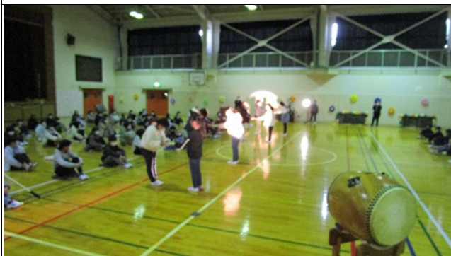
在校生からのプレゼント・・・