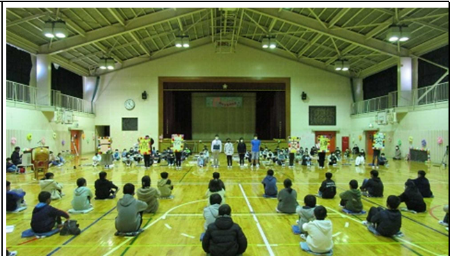
6年生からのメッセージ・・・