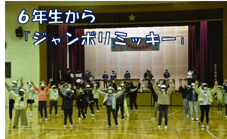
6年生から 「ジャンボロミッキー」