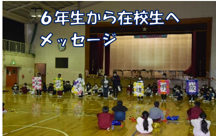
6年生から在校生へ メッセージ