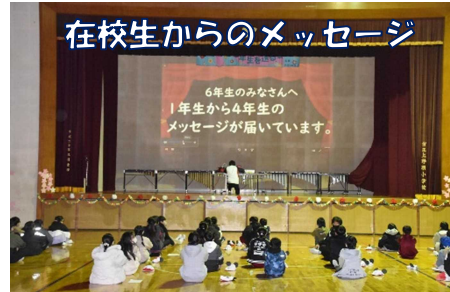
在校生からのメッセージ