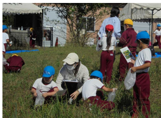
秋の校外学習 (1年生)

82日間のあゆみで達成した2学期の成果を大切にしましょう。そして、まとめの学期である3学期に㊦たらしい目標をもって、㊧めに向かって、㊨らいの自分のために㊩㊪㊫を進められるように、健康・安全に留意し、有意義な冬休みをお過ごしください。