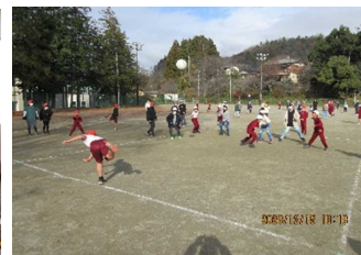
ドッジボール大会 (全校)