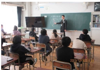
中学校体験授業 (6年生)