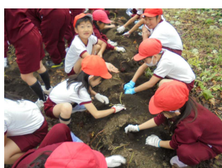
さつまいも掘り (2年生)